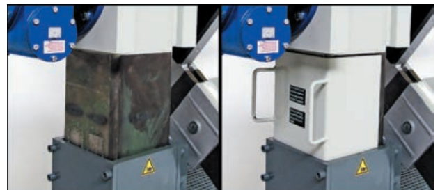
Abbildung mit Sicherungsblech / Picture with safety plate

WW-PS-2500 Podest-seitlich / Podium side (500 mm x 1500 mm)