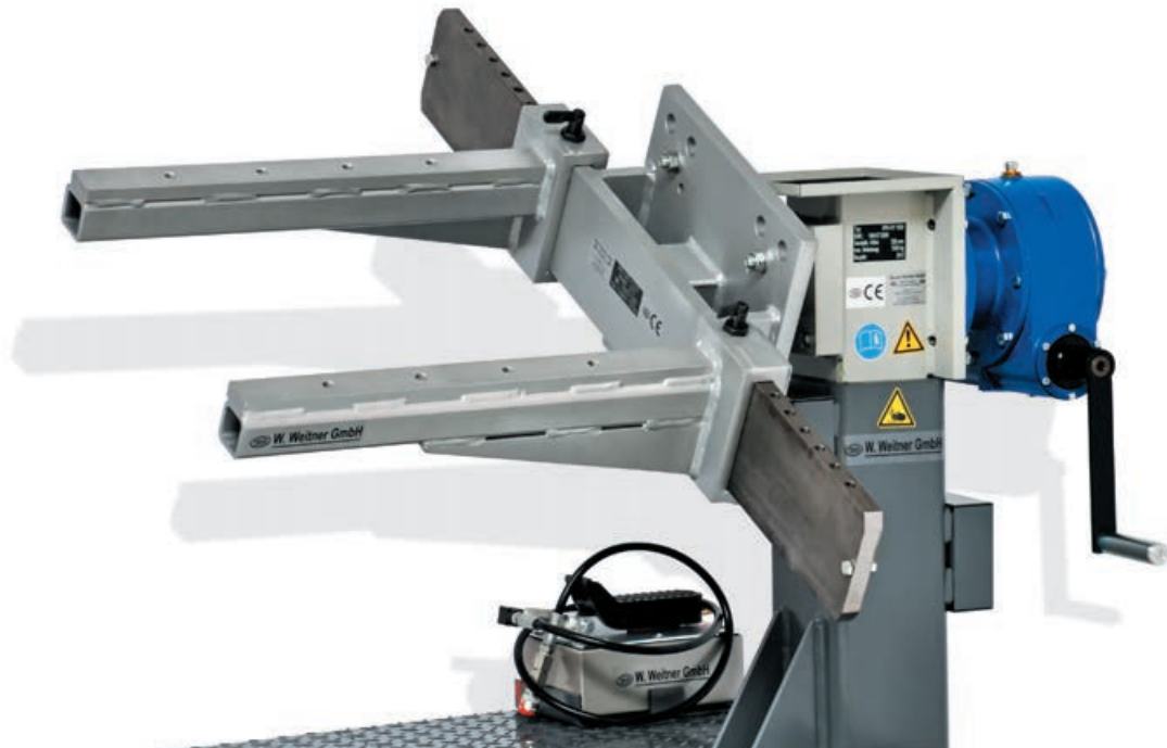
Abbildung mit Universal Aufnahme WW-UAG-1200 Picture with Universal Adapter WW-UAG-1200